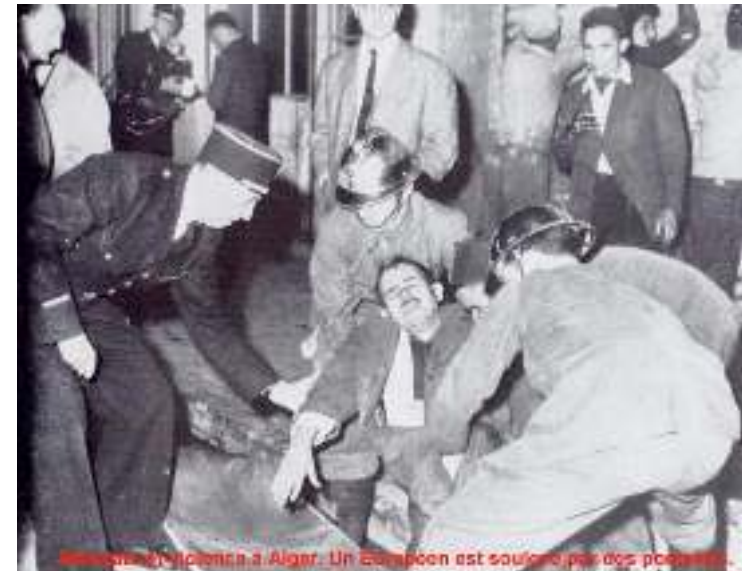
Eines vieler Attentate in Algiers