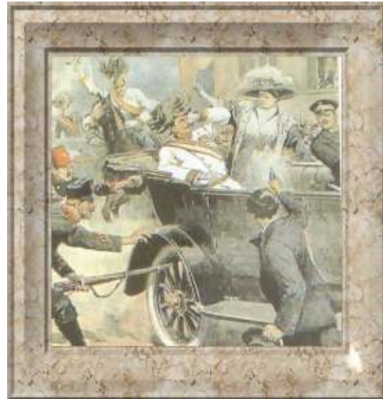
Das Attentat von Sarajewo