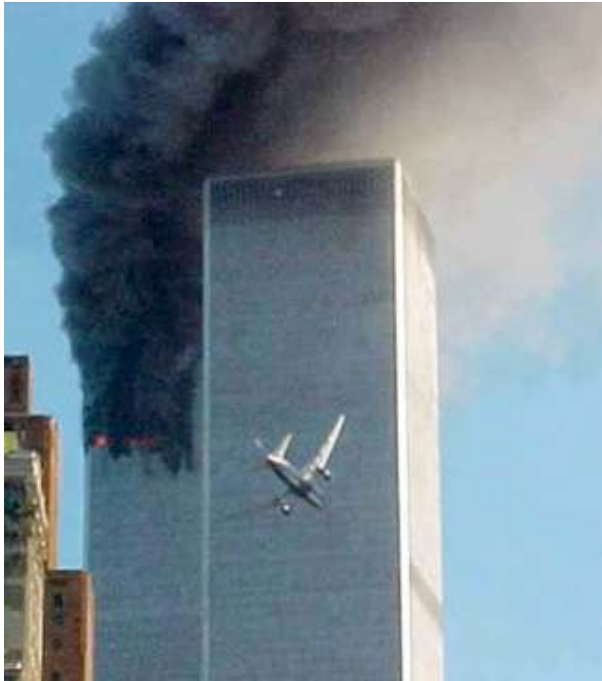
11. September 2001, New York