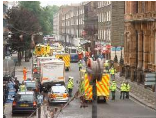
7. Juli 2005, London