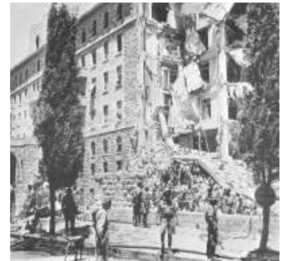
91 Personen sterben beim Bombenattentat gegen das David Hotel 1946