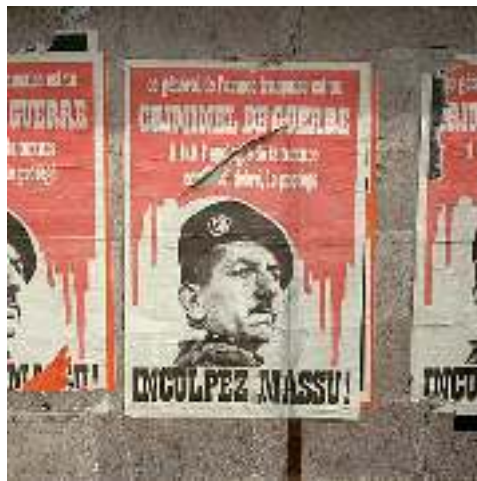
General Jaques Massu