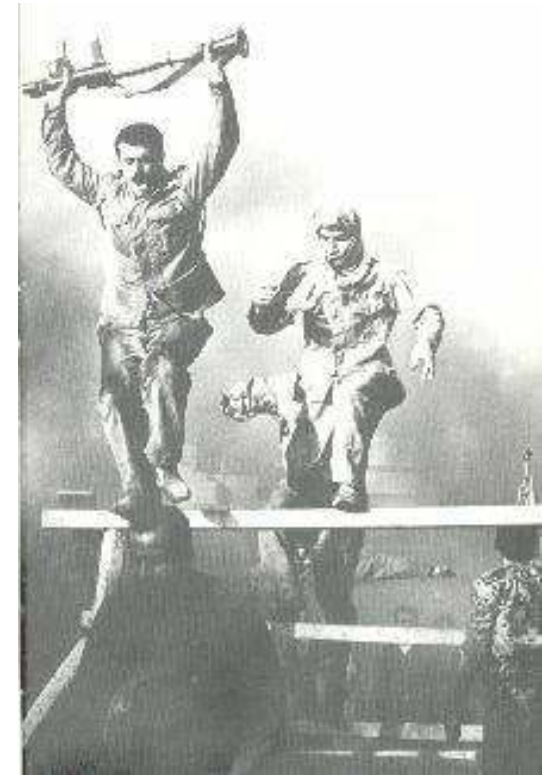
Trainingslager der PLO