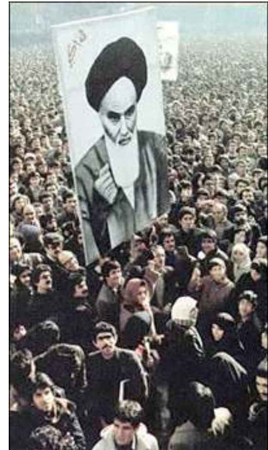
Die iranische Revolution 1979