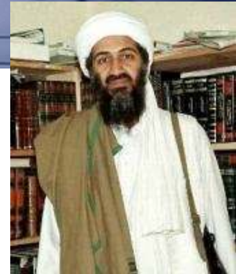
Osama bin Laden