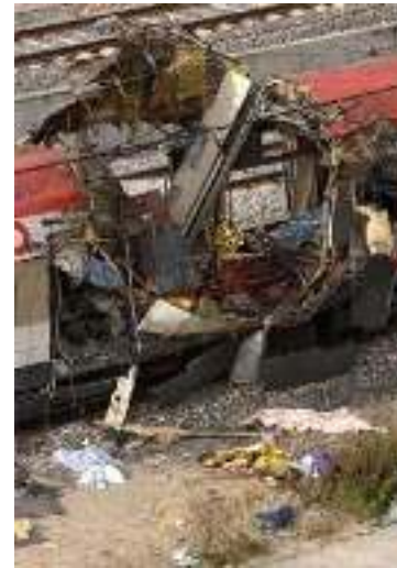
11. März 2004, Madrid