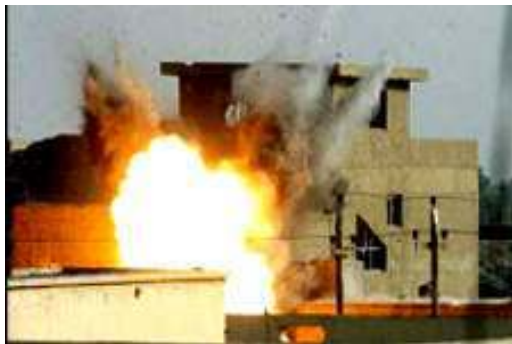
Die Schlacht von Falluja, April 2004