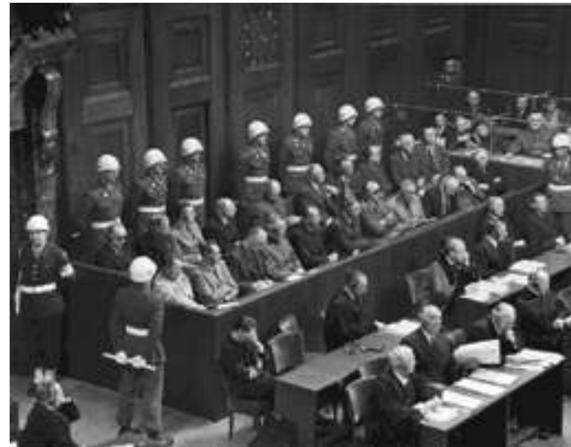
Nürnberger Kriegsverbrecherprozesse 1945