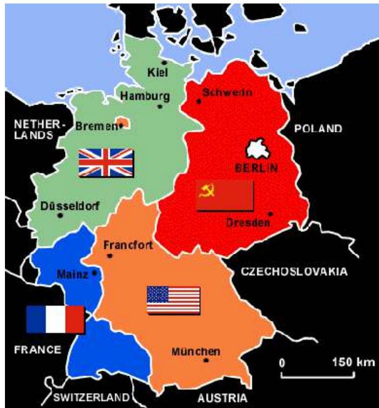
Die Besatzung Deutschlands