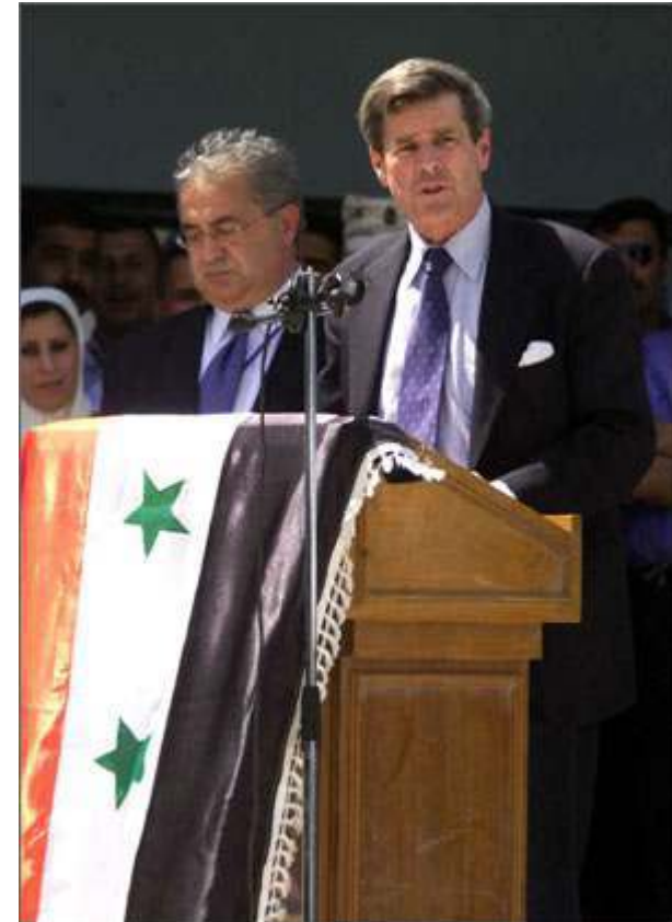
L. Paul Bremer