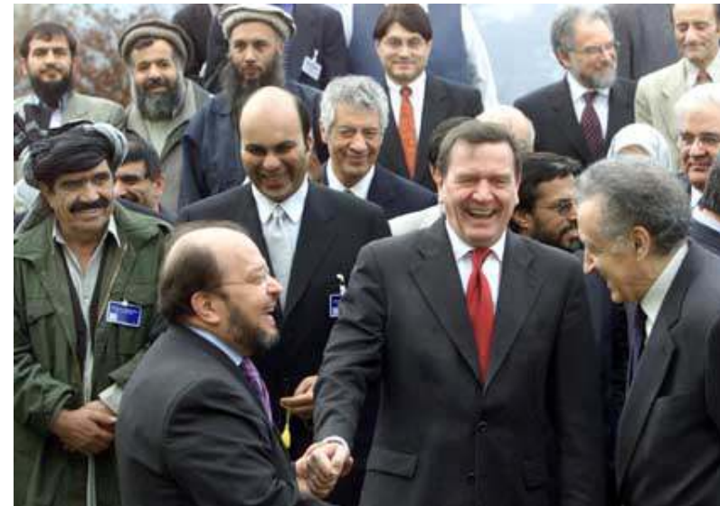
Bonner Konferenz im Dez. 2001