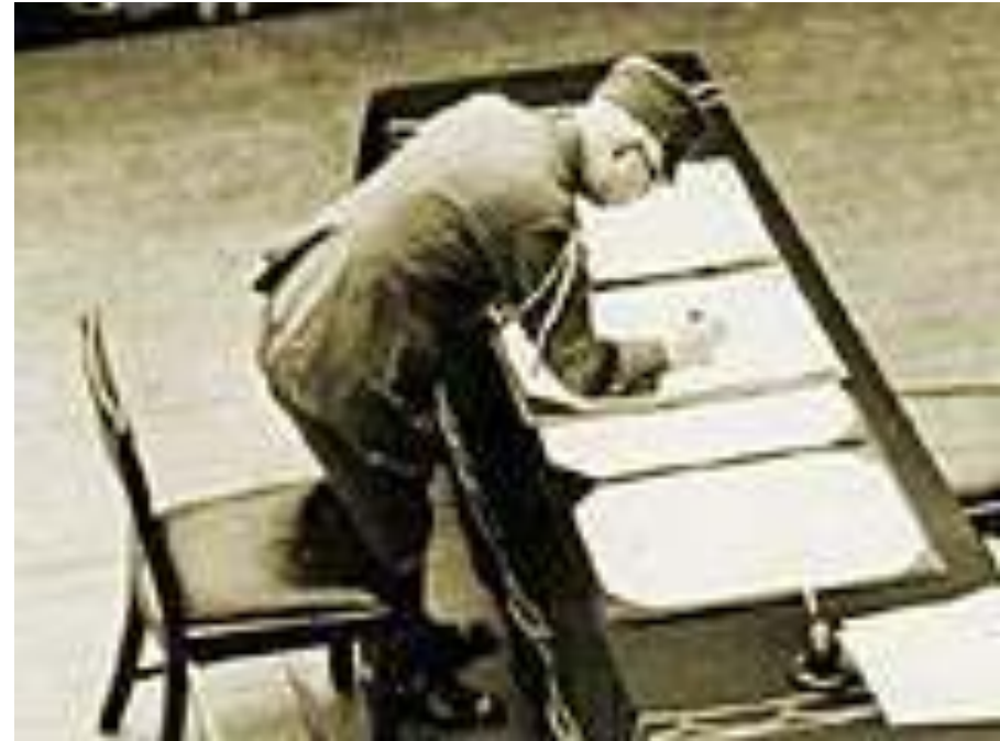
Der japanische Kaiser unterzeichnet die Kapitulation Japans am 2. September 1945 auf USS Missouri