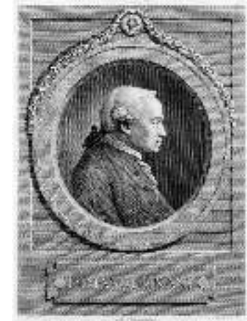
Immanuel Kant 1724-1804