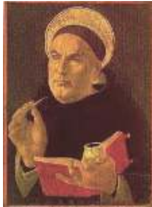
Thomas von Aquin 1224-1274