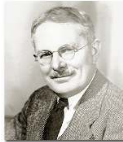
Quincy Wright 1890-1970