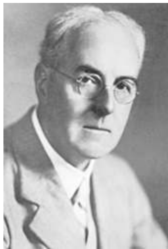
Lewis Fry Richardson 1881-1953