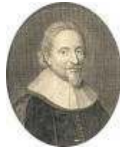
Hugo Grotius 1583-1645