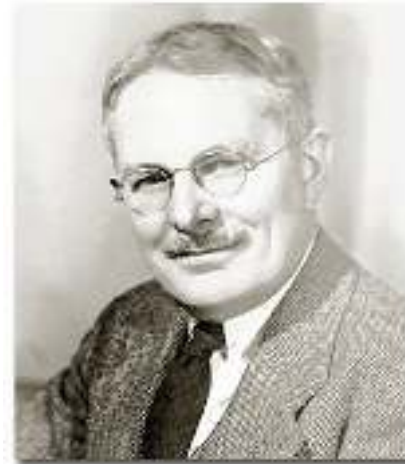
Quincy Wright 1890-1970