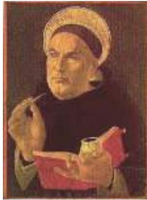
Thomas von Aquin 1224-1274