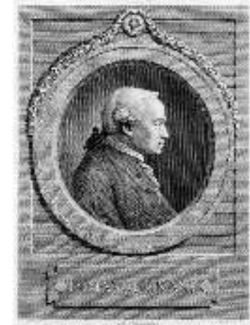
Immanuel Kant 1724-1804