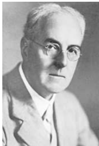
Lewis Fry Richardson 1881-1953