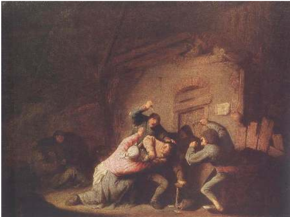
„Prügelei“ von Adriaen van Ostade, Öl auf Holz, Puschkin Museum, Moskau