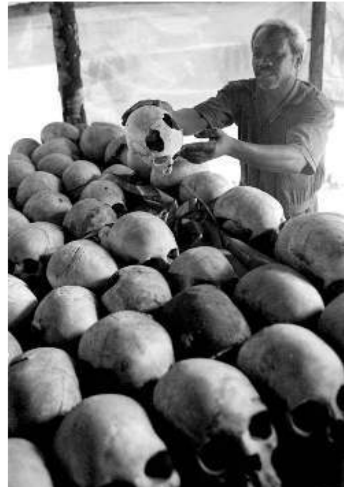
Die offizielle Gedenkstätte des Dorfes Ntarama, Ruanda