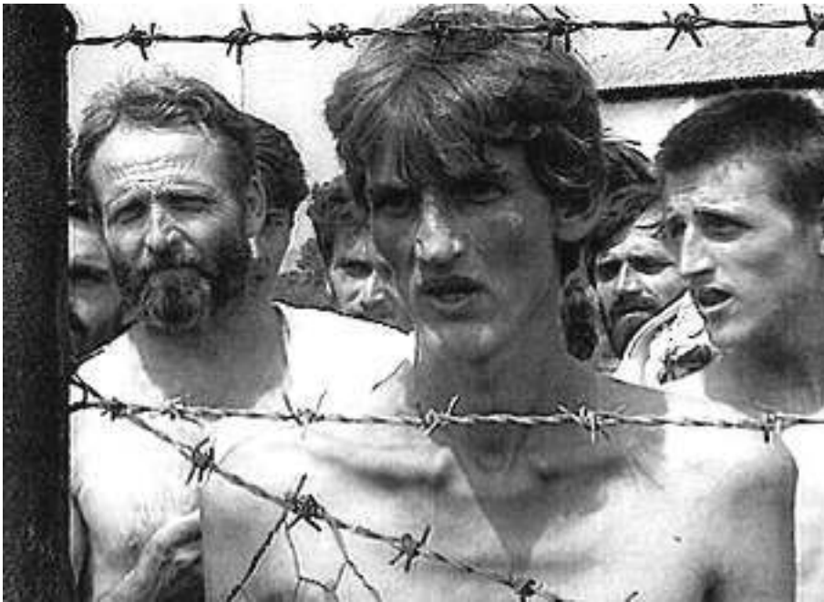
Konzentrationslager in Bosnien