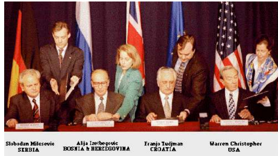
Slobodan Milosevic SERBIA

Das Dayton-Abkommen von 1995 beendet die erste Gewaltwelle