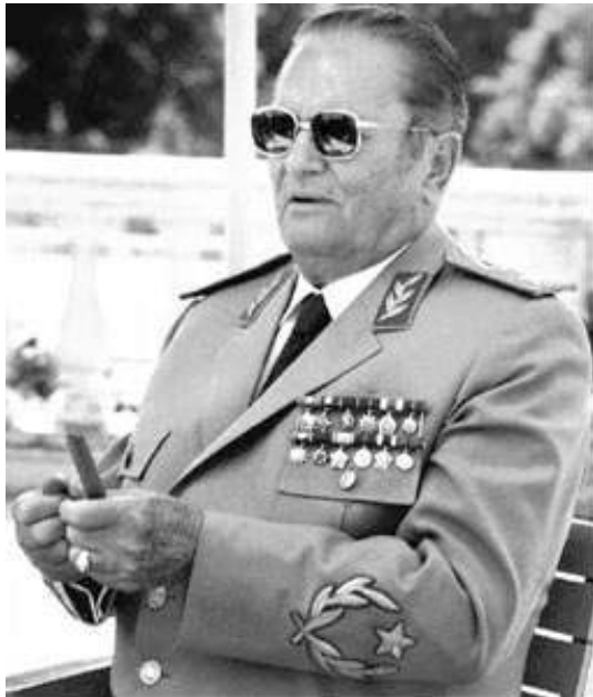
Josip Broz Tito (1882-1980)