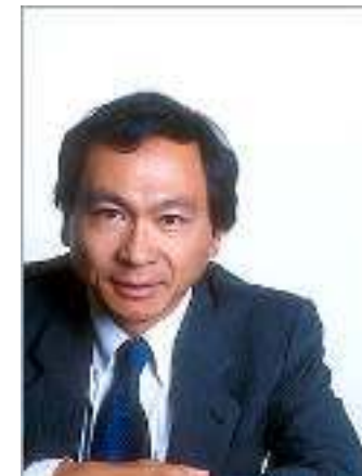
Francis Fukuyama: „The end of history“

Das Brandenburger Tor als Symbol der Wiedervereinigung Deutschlands