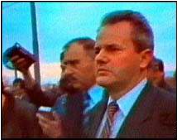
Slobodan Milosevic schürt den serbischen Nationalismus 1987 im Kosovo

Franjo Tudjman mobilisiert die kroatischen Nationalisten