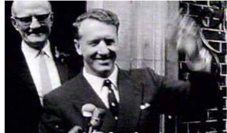
Ian Smiths Rhodesien widersteht Sanktionen