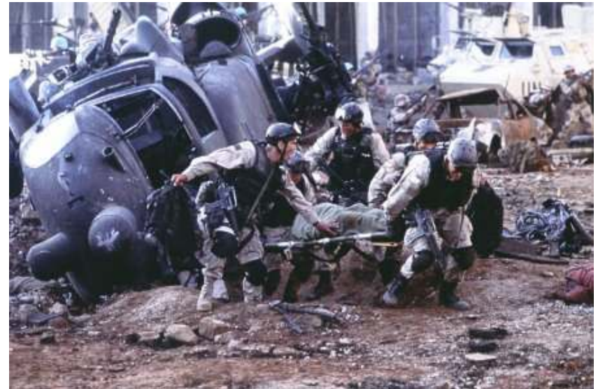
Szene aus dem Film „Black Hawk Down“