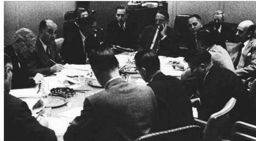
Organizing the first peacekeeping force, the UN Emergency Force; November, 1956