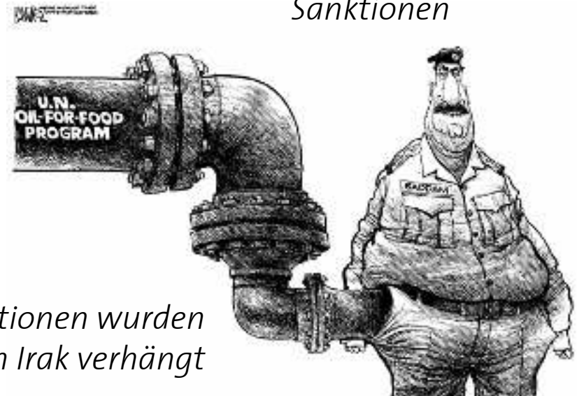
Wirtschaftliche Sanktionen wurden 1990 gegen den Irak verhängt