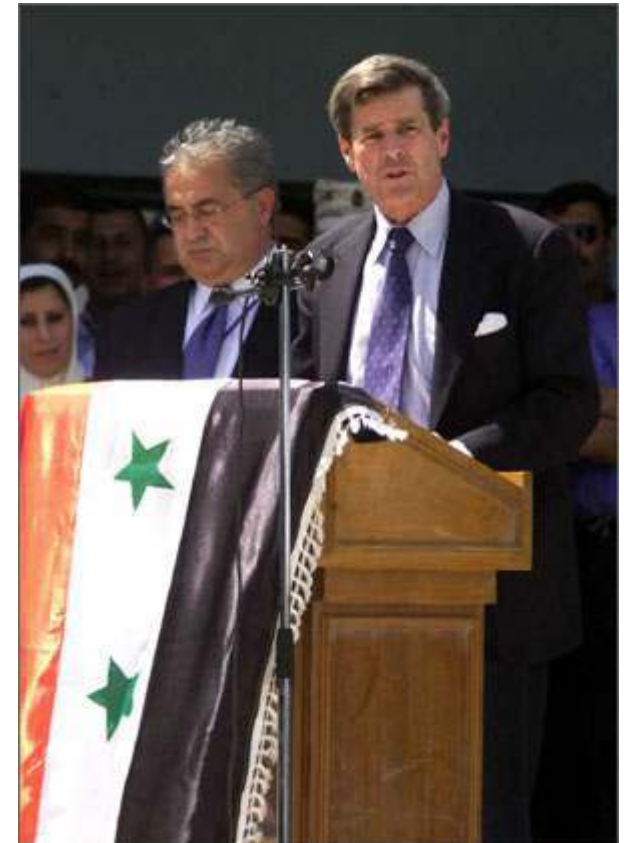
L. Paul Bremer