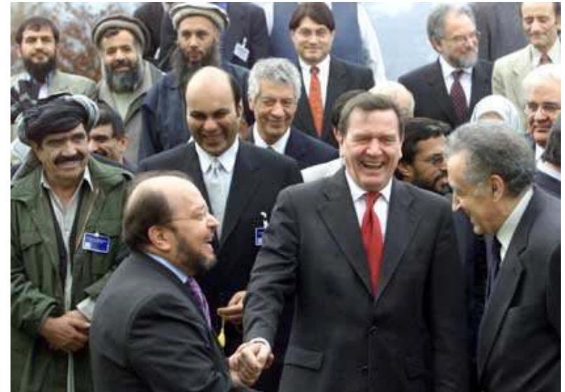
Bonner Konferenz im Dez. 2001