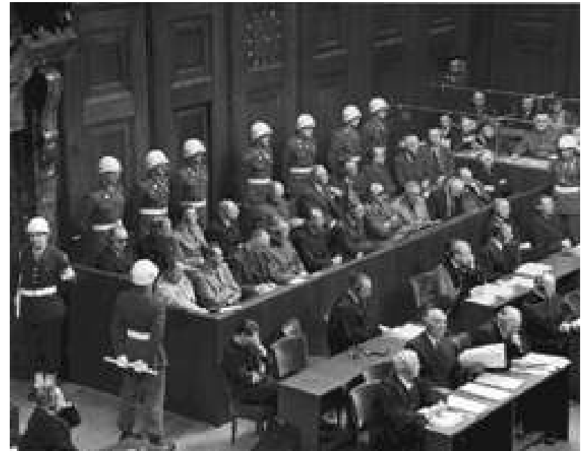
Nürnberger Kriegsverbrecherprozesse 1945