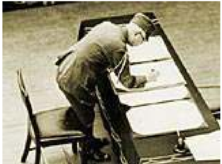
Der japanische Kaiser unterzeichnet die Kapitulation Japans am 2. September 1945 auf USS Missouri