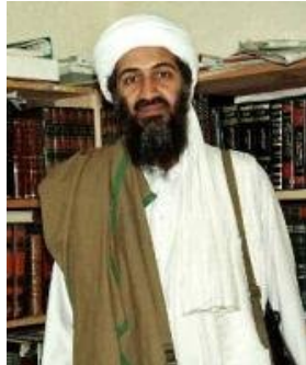
Osama bin Laden

Der internationale Terrorismus verübt Attentate im Ausland, um internationale Aufmerksamkeit zu erzielen