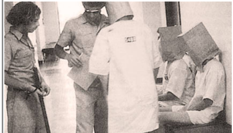
Stanford Prison Experiment, 1971